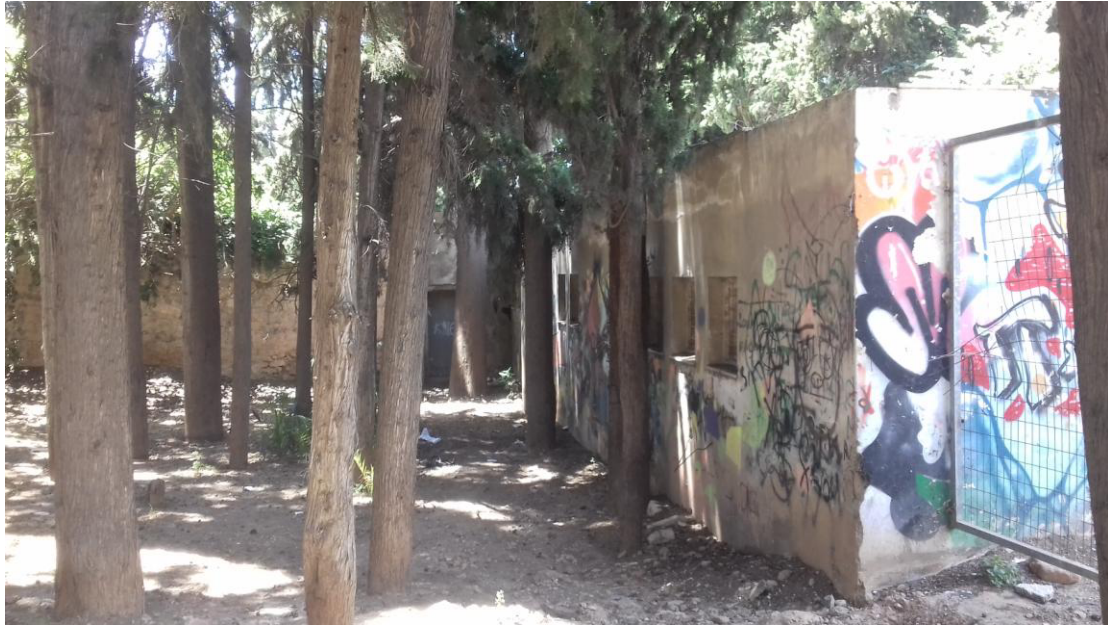
Η Βόρεια πλευρά των γραφείων Σκοπευτικής