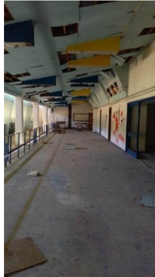
Φωτογραφίες από τα σημεία που στόχευαν οι αθλητές