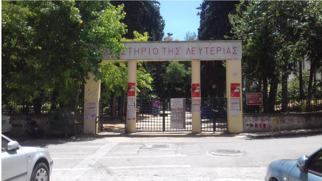
Η κεντρική είσοδος