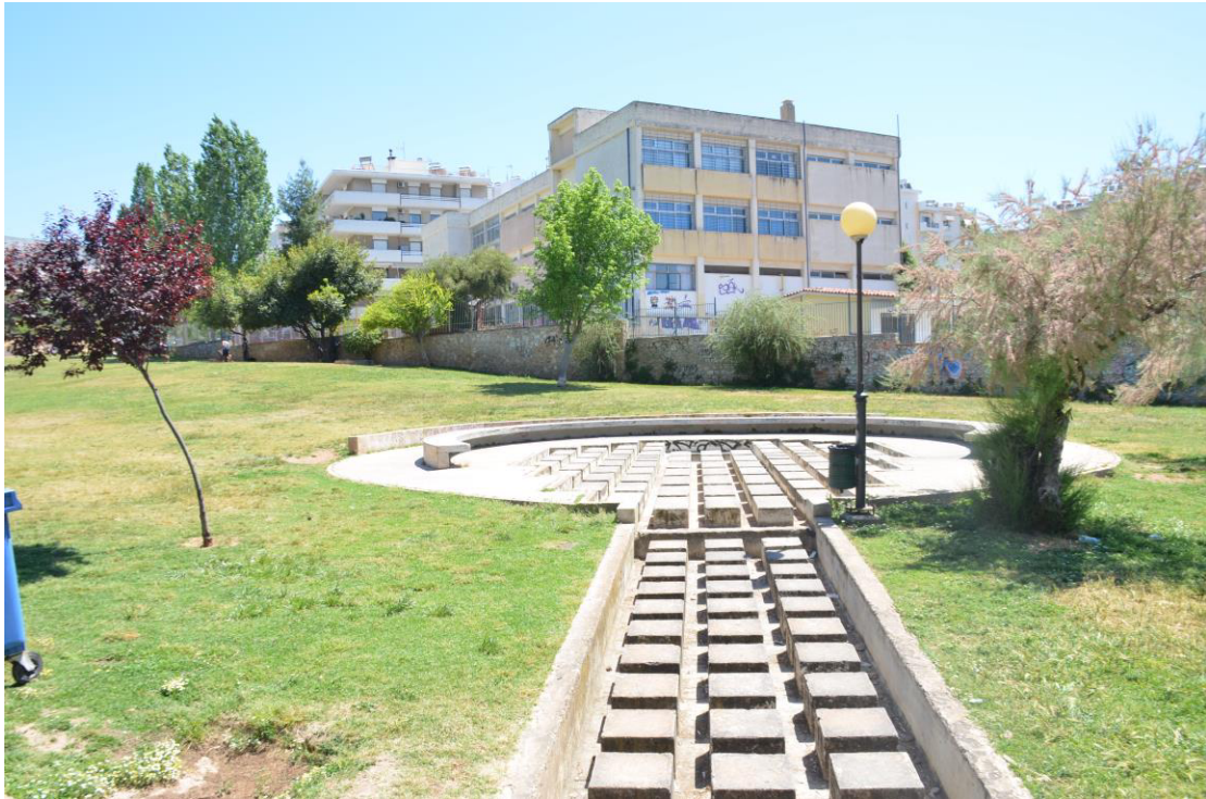
Το σιντριβάνι νότια