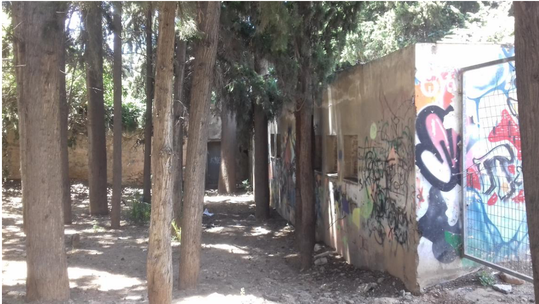
Η Βόρεια πλευρά των γραφείων Σκοπευτικής