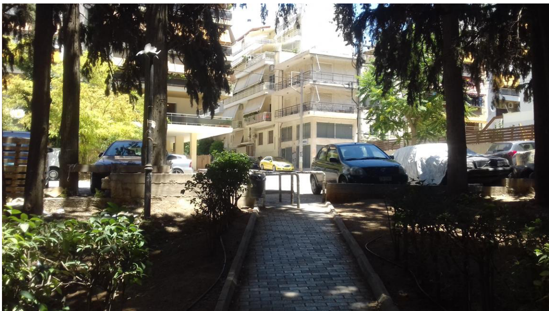
Η είσοδος πίσω από το Χάραμα