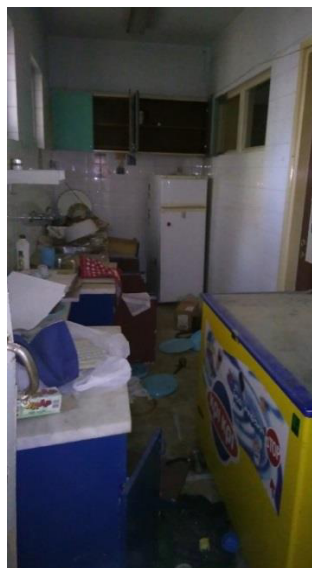
Φωτογραφίες από τους γραφειακούς χώρους