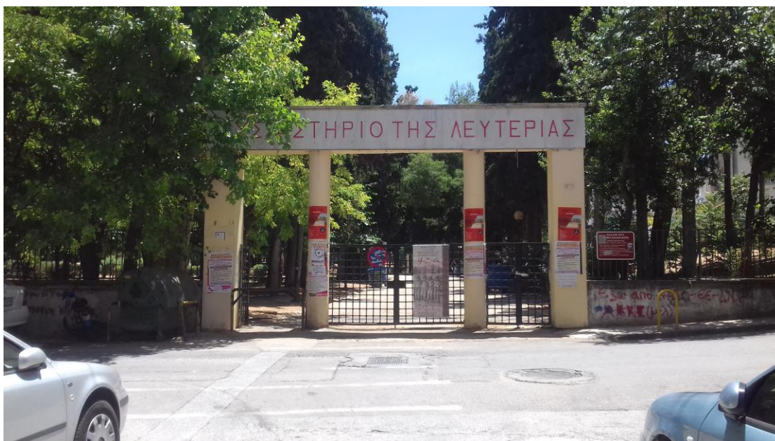
Η κεντρική είσοδος