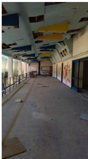
Φωτογραφίες από τα σημεία που στόχευαν οι αθλητές