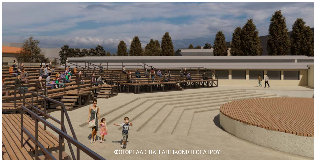
ΦΩΤΟΡΕΑΛΙΣΤΙΚΗ ΑΠΕΙΚΟΝΙΣΗ ΘΕΑΤΡΟΥ

• Το ιστορικό «Χάραμα» του Τσιτσάνη, του Παπαϊωάννου, της Μπέλλου και τόσων άλλων, θα στεγάσει μουσικές δραστηριότητες σχετικές με τη λαϊκή μουσική και το χορό.