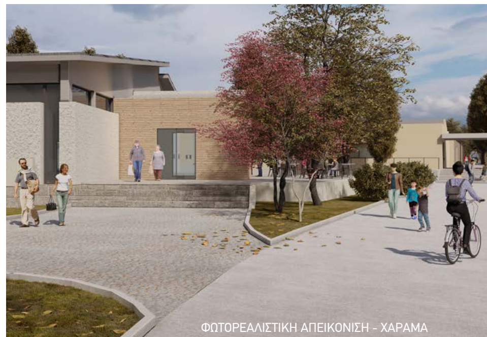
ΦΩΤΟΡΕΑΛΙΣΤΙΚΗ ΑΠΕΙΚΟΝΙΣΗ - ΧΑΡΑΜΑ