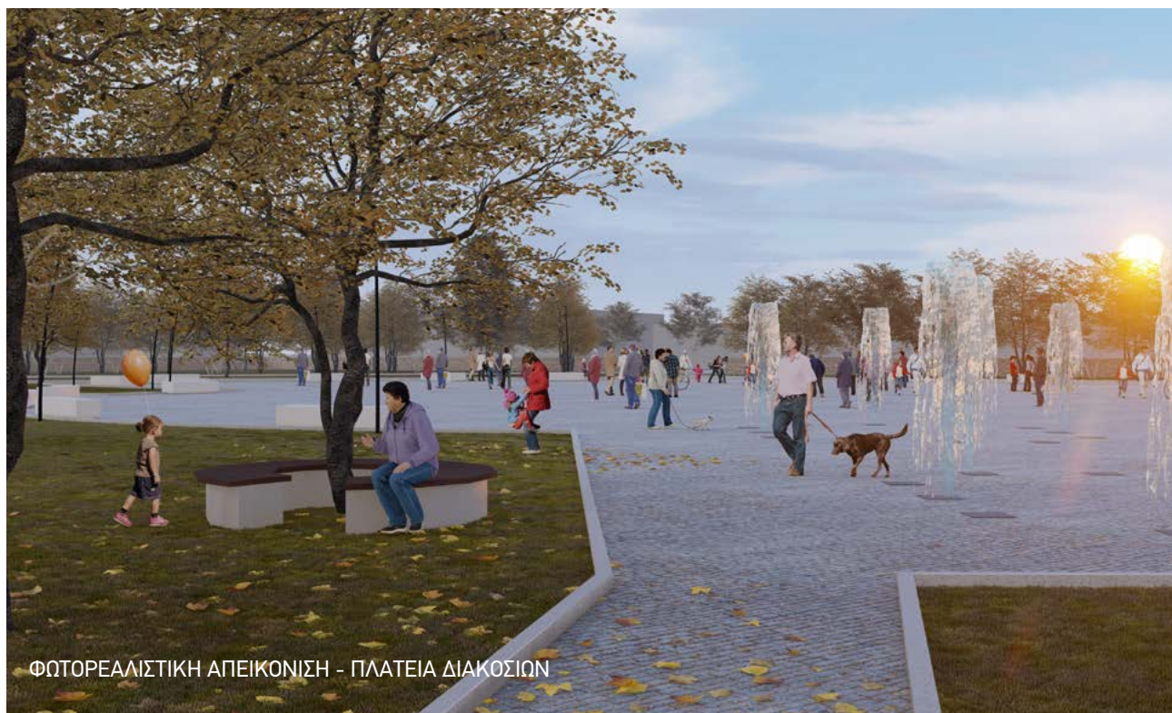
ΦΩΤΟΡΕΑΛΙΣΤΙΚΗ ΑΠΕΙΚΟΝΙΣΗ - ΠΛΑΤΕΙΑ ΔΙΑΚΟΣΙΩΝ

Ε να έργο μεγάλης εμβέλειας, που θα προσφέρει σημαντικά στους κατοίκους της πόλης αλλά και της ευρύτερης περιοχής του Λεκανοπεδίου, προχωράει στο πάρκο του Σκοπευτηρίου.