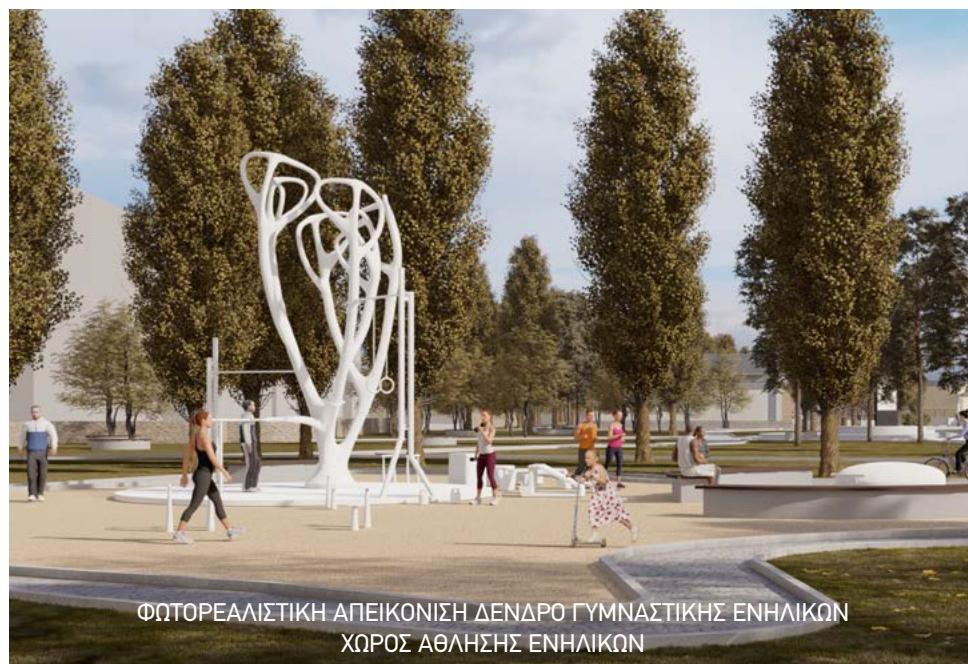
ΦΩΤΟΡΕΑΛΙΣΤΙΚΗ ΑΠΕΙΚΟΝΙΣΗ ΔΕΝΔΡΟ ΓΥΜΝΑΣΤΙΚΗΣ ΕΝΗΛΙΚΩΝ ΧΩΡΟΣ ΑΘΛΗΣΗΣ ΕΝΗΛΙΚΩΝ

Είναι χαρακτηριστικό ότι αυτή τη στιγμή ο Δήμος διαθέτει μόνο μία Αίθουσα Εκδηλώσεων και τον Δημοτικό Κινηματογράφο, με αποτέλεσμα το πλούσιο πολιτιστικό πρόγραμμα των φορέων της πόλης και των μαθητών, να