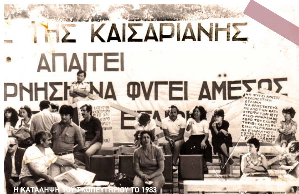
Η ΚΑΤΑΛΗΨΗ ΤΟΥ ΣΚΟΠΕΥΤΗΡΙΟΥ ΤΟ 1983